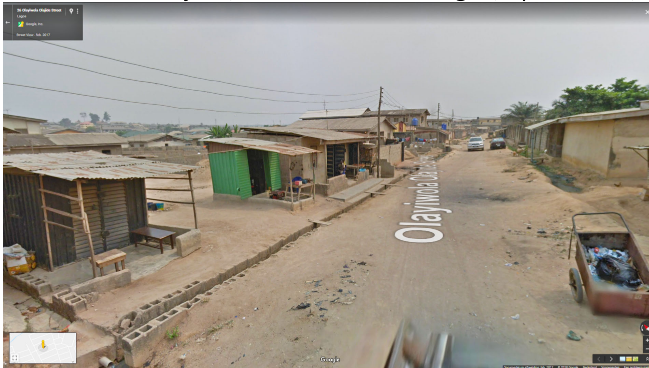
Een zelfbouwwijk in Ijegan, Lagos.