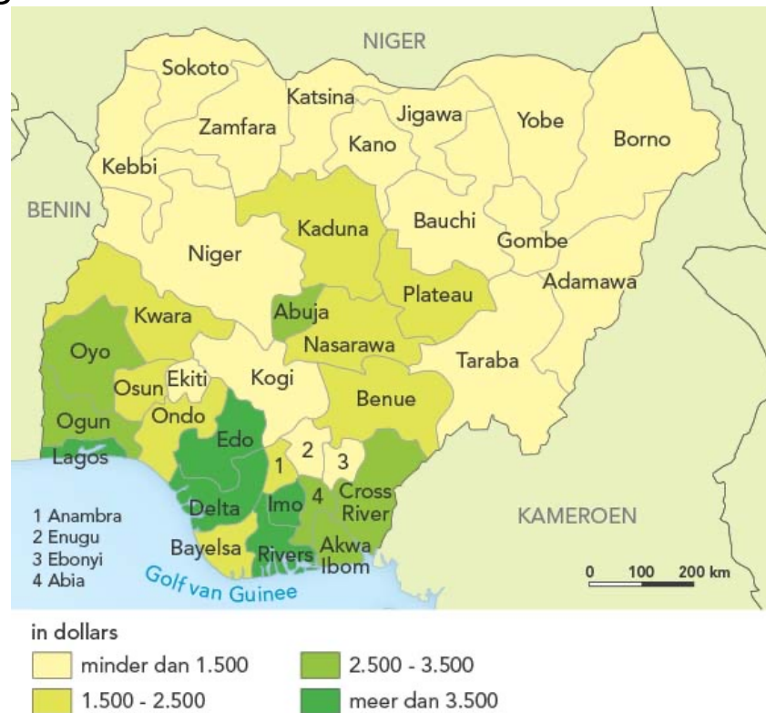
Nigeria: bnp per hoofd van de bevolking, 2008.